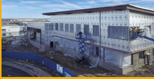
LA ENVOLVENTE PROTECTORA

Sika es una empresa química especializada con una posición de liderazgo en el desarrollo y la producción de sistemas y productos para pegar, sellar, amortiguar, reforzar y proteger en el sector de la construcción y en la industria del automóvil. Las líneas de productos de Sika incluyen aditivos para hormigón, morteros, selladores y adhesivos, así como sistemas de refuerzo estructural, así como sistemas de impermeabilización y techado.