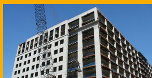
REPARACIÓN DE CONCRETO