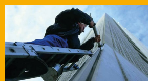
SELLADORES Y ADHESIVOS