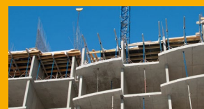
FUNDICIÓN IN-SITU Y PREFABRICADOS DE CONCRETO