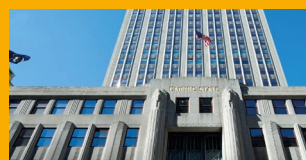
REPARACIÓN Y PROTECCIÓN