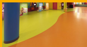
PISOS Y MUROS