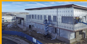
LA ENVOLVENTE PROTECTORA

Sika es una empresa química especializada con una posición de liderazgo en el desarrollo y la producción de sistemas y productos para pegar, sellar, amortiguar, reforzar y proteger en el sector de la construcción y en la industria del automóvil. Las líneas de productos de Sika incluyen aditivos para hormigón, morteros, selladores y adhesivos, así como sistemas de refuerzo estructural, así como sistemas de impermeabilización y techado.