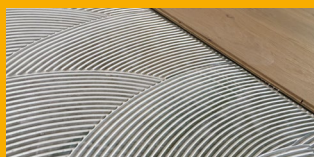
INSTALACIÓN DE PISOS