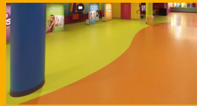
PISOS Y MUROS