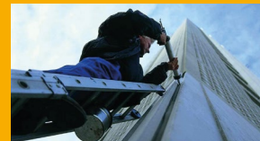
SELLADORES Y ADHESIVOS