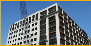
REPARACIÓN DE CONCRETO