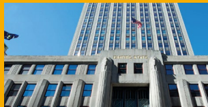
REPARACIÓN Y PROTECCIÓN