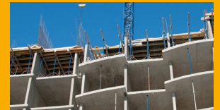
FUNDICIÓN IN-SITU Y PREFABRICADOS DE CONCRETO