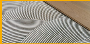
INSTALACIÓN DE PISOS