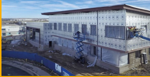
LA ENVOLVENTE PROTECTORA

Sika es una empresa química especializada con una posición de liderazgo en el desarrollo y la producción de sistemas y productos para pegar, sellar, amortiguar, reforzar y proteger en el sector de la construcción y en la industria del automóvil. Las líneas de productos de Sika incluyen aditivos para hormigón, morteros, selladores y adhesivos, así como sistemas de refuerzo estructural, así como sistemas de impermeabilización y techado.